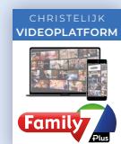
Family 7+ 6 maanden