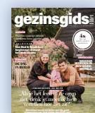
GezinsGids 3 maanden, 3 nummers