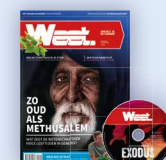
Weet Magazine 6 maanden, 3 nummers + DVD

Of kies een van de andere cadeaus, bijvoorbeeld: