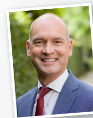
Gert-Jan Segers Voorzitter Tweede Kamerfractie

Ik wens u hoopvolle en gezegende kerstdagen,