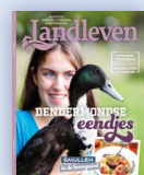
Landleven 3 maanden, 3 nummers