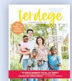
Terdege 3 maanden, 6 nummers