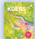
De Nieuwe Koers 6 maanden, 5 nummers